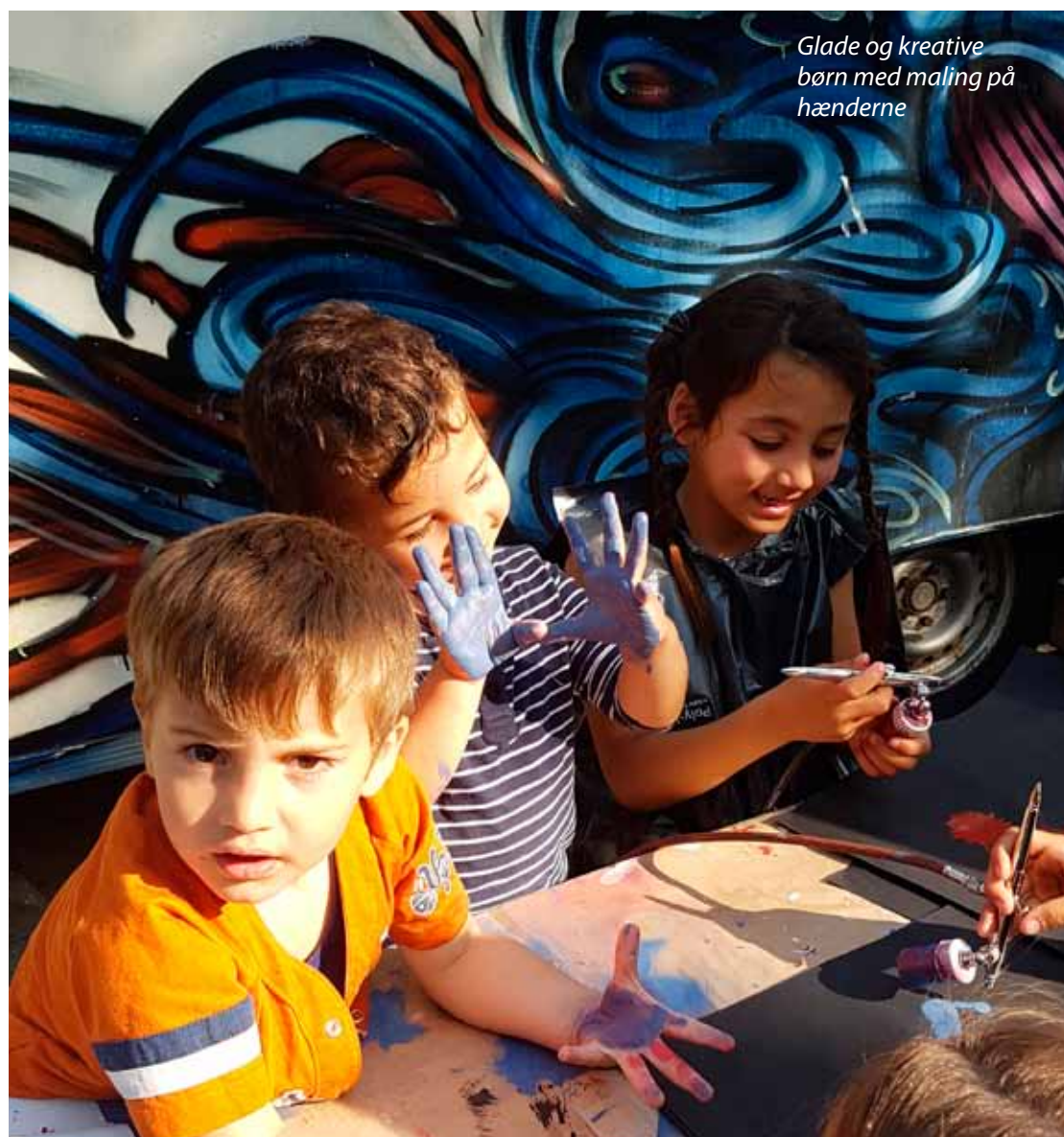
Glade og kreative børn med maling på hænderne

2017. Tilmeldingen sker for en hel sæson, hvor der er indlagt de normale ferieperioder. Sæsonen afsluttes med en fælles udstilling på KØS Museum for Kunst i det offentlige rum, Nørregade 29, i Køge. Frist for tilmelding er mandag den 5. september 2016. Tilmeldingen sker på www.køgebilledskole.dk .